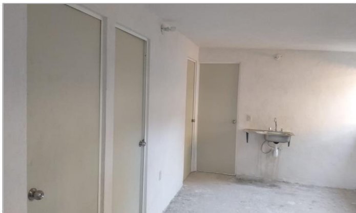
VISTA INTERIOR Y COLOCACIÓN DE TARJA