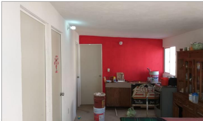
VISTA INTERIOR Y COLOCACIÓN DE TARJA