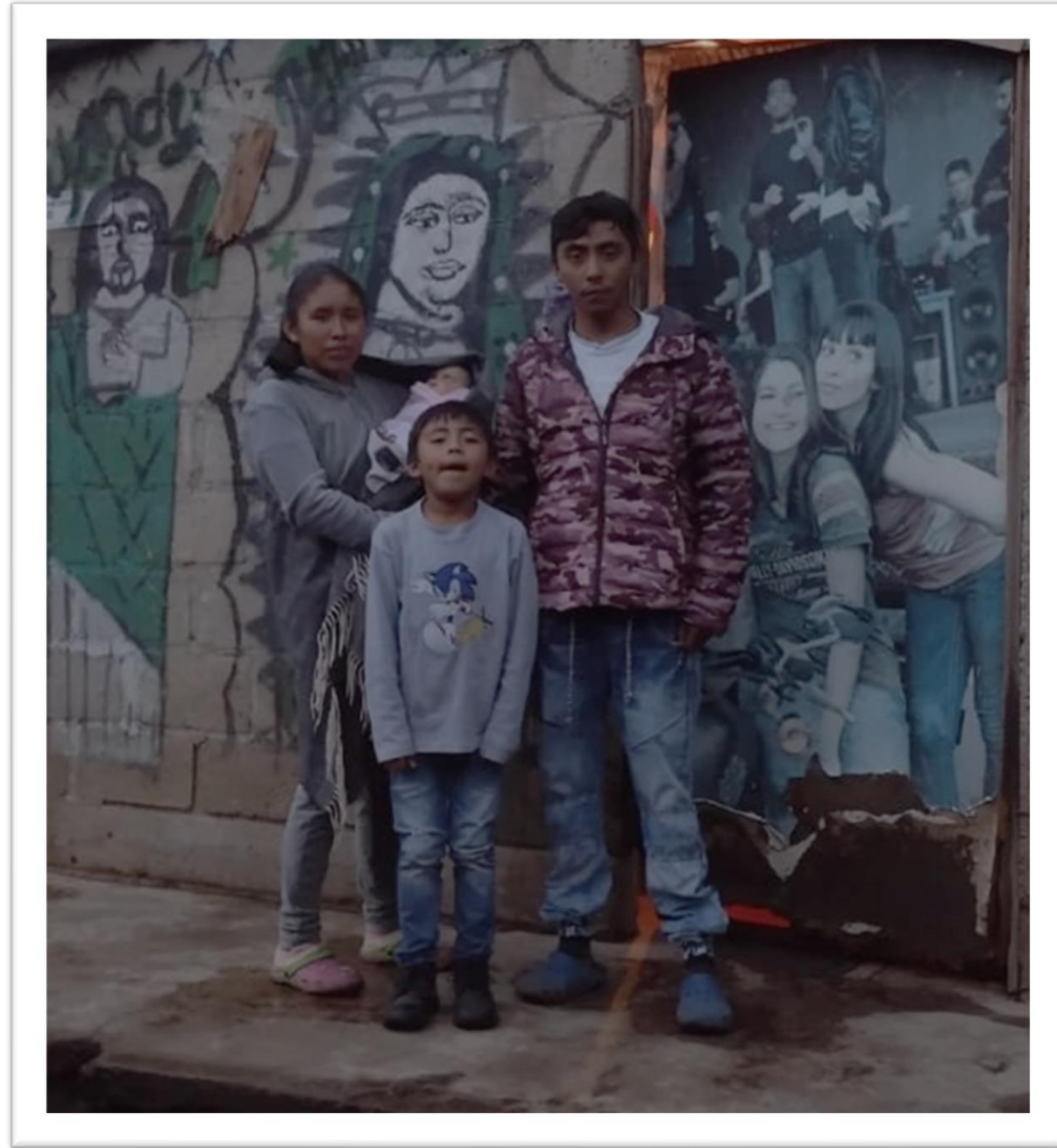
ANTES DE LA INTERVENCIÓN