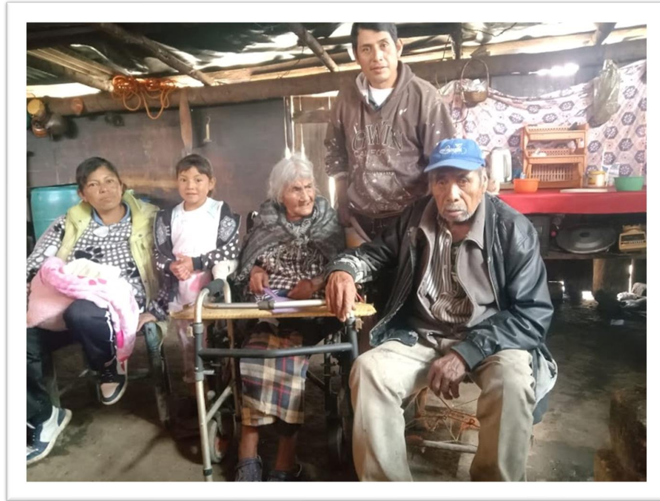
ANTES DE LA INTERVENCIÓN