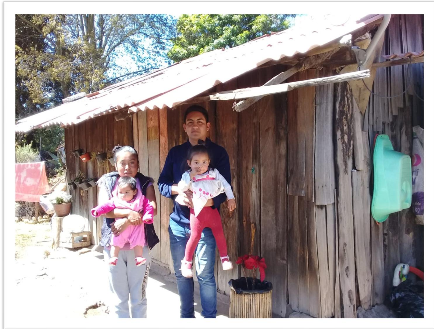
ANTES DE LA INTERVENCIÓN