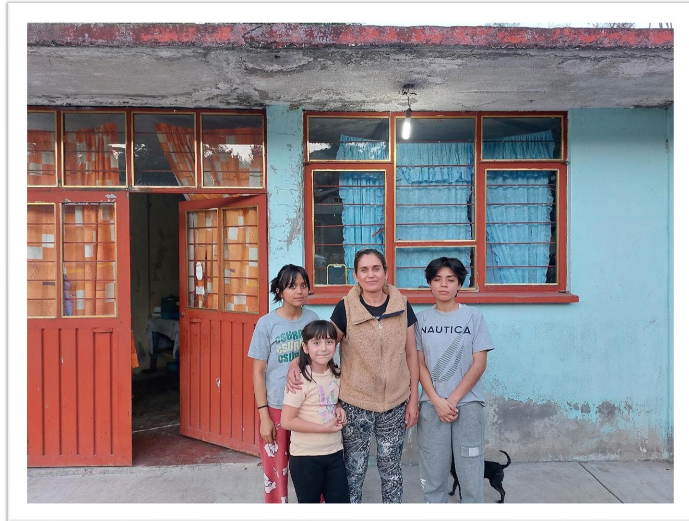
ANTES DE LA INTERVENCIÓN