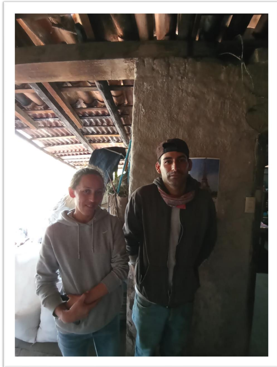
ANTES DE LA INTERVENCIÓN