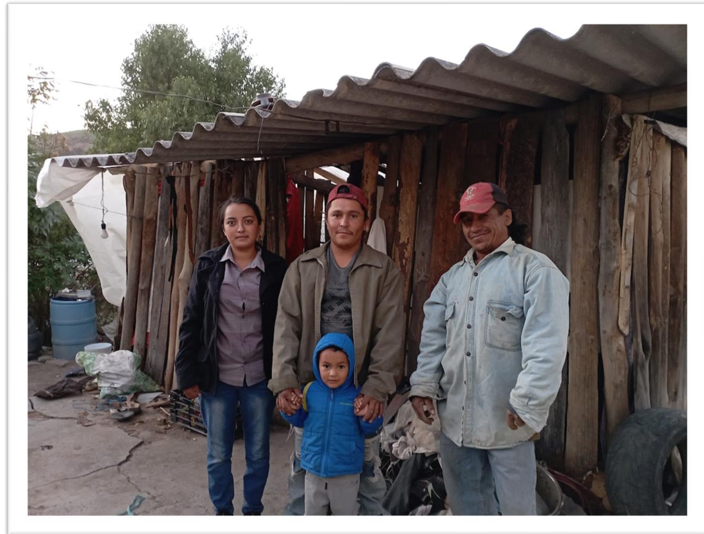
ANTES DE LA INTERVENCIÓN