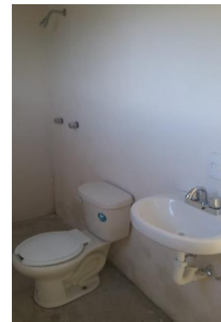
COLOCACIÓN DE MUEBLES DE BAÑO