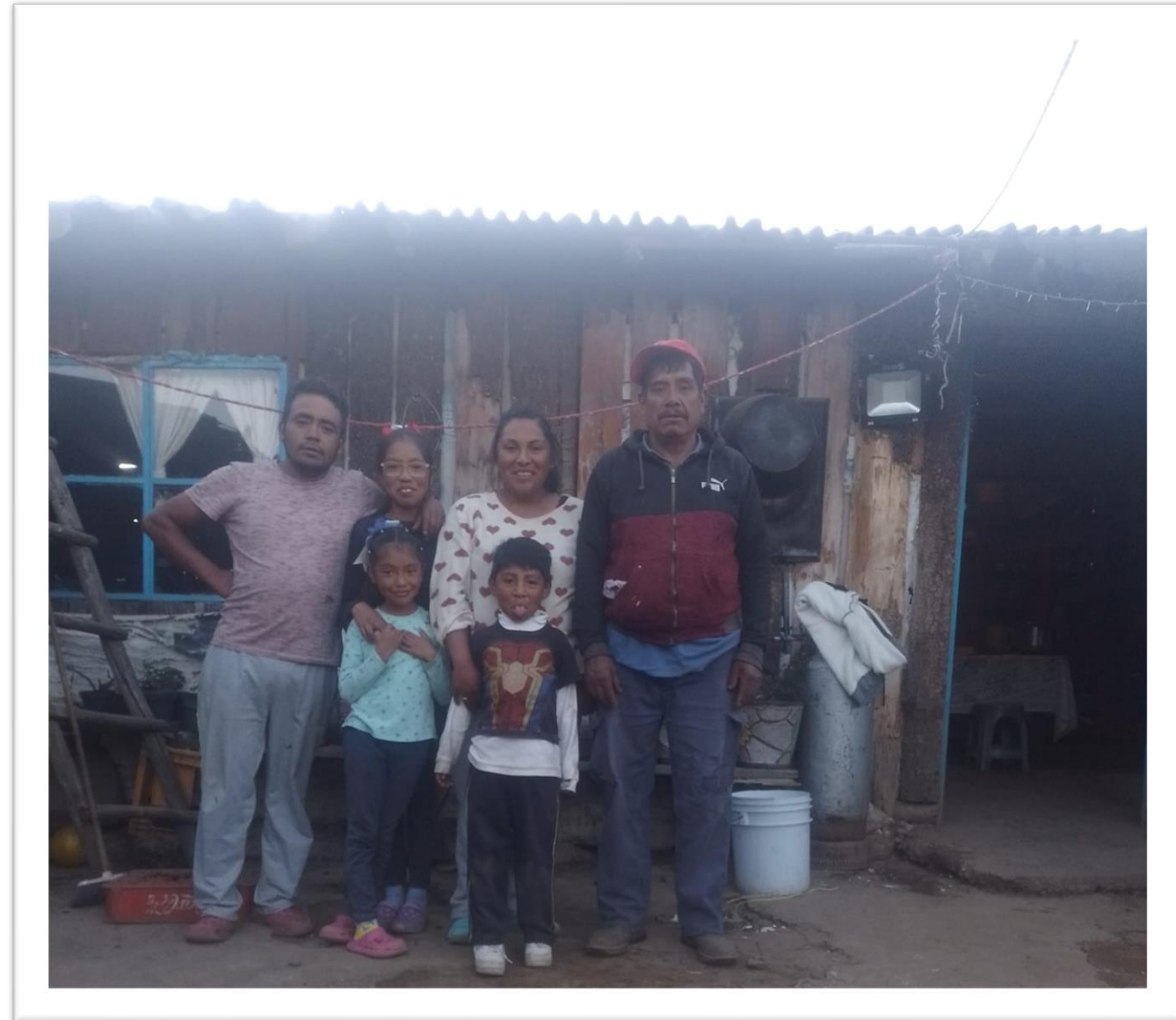
ANTES DE LA INTERVENCIÓN