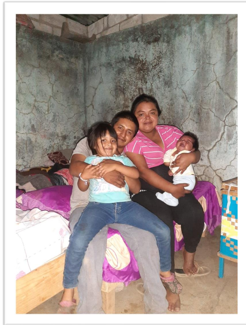
ANTES DE LA INTERVENCIÓN