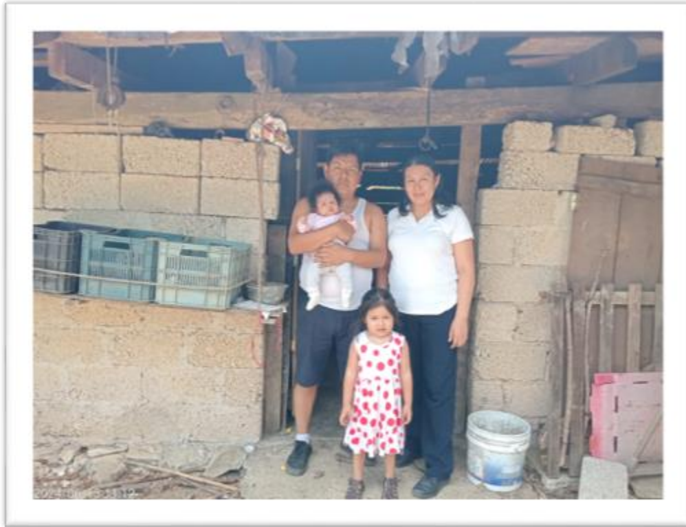
ANTES DE LA INTERVENCIÓN