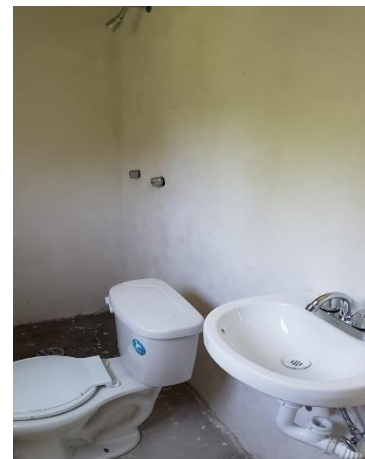
COLOCACIÓN DE MUEBLES DE BAÑO