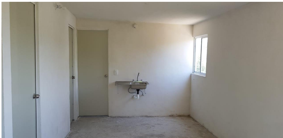
VISTA INTERIOR Y COLOCACIÓN DE TARJA