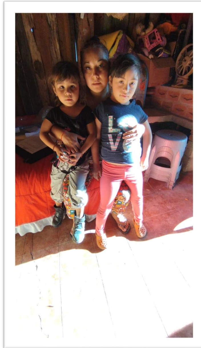
ANTES DE LA INTERVENCIÓN