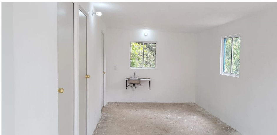
VISTA INTERIOR Y COLOCACION DE TARJA