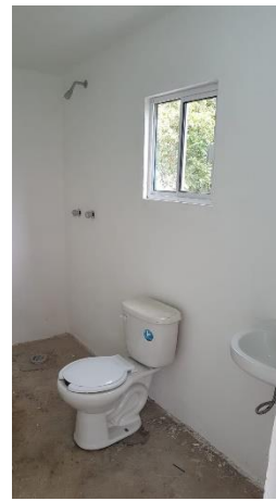
COLOCACION DE MUEBLES DE BAÑO