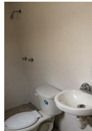
COLOCACIÓN DE MUEBLES DE BAÑO