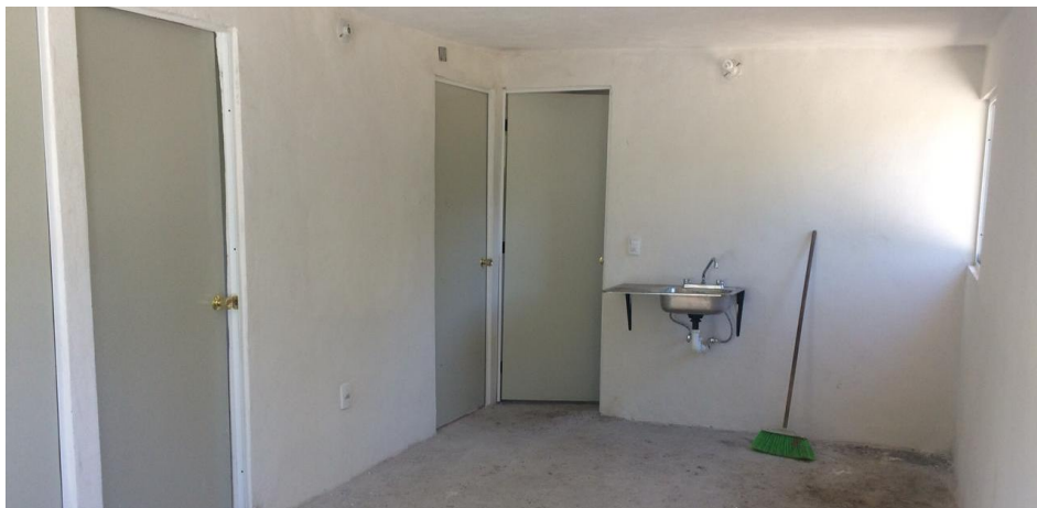
VISTA INTERIOR Y COLOCACIÓN DE TARJA