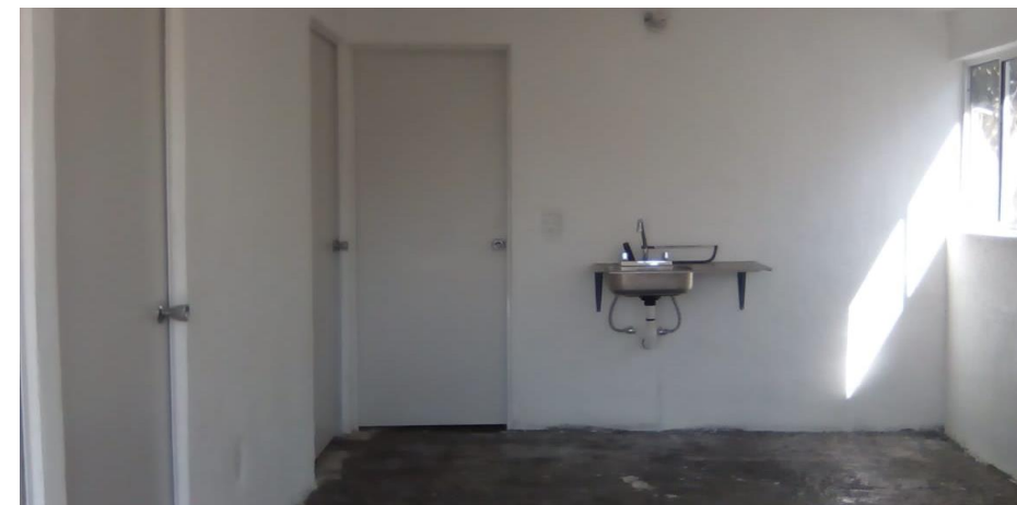
VISTA INTERIOR Y COLOCACIÓN DE TARJA