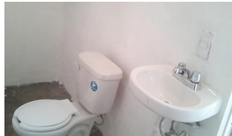
COLOCACIÓN DE MUEBLES DE BAÑO