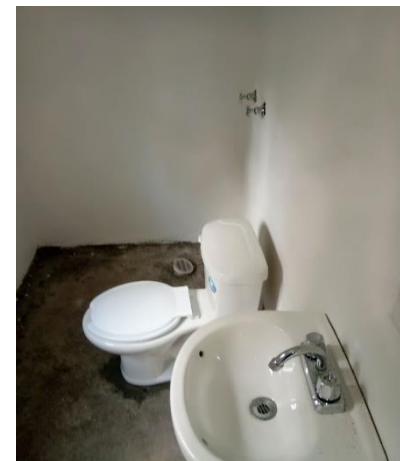
COLOCACION DE MUEBLES DE BAÑO