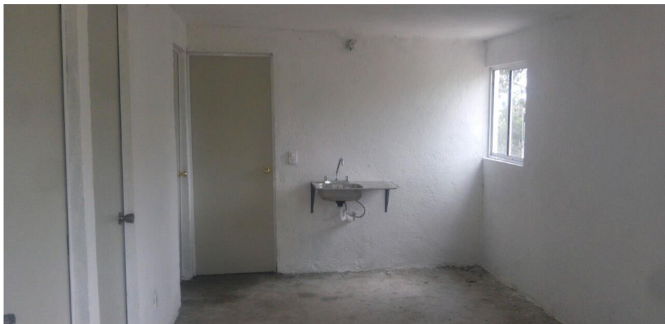
VISTA INTERIOR Y COLOCACION DE TARJA