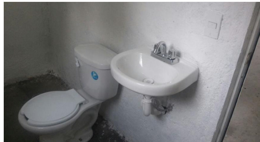
COLOCACION DE MUEBLES DE BAÑO