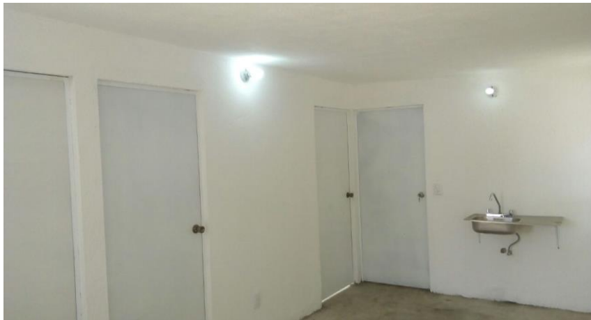
VISTA INTERIOR Y COLOCACION DE TARJA