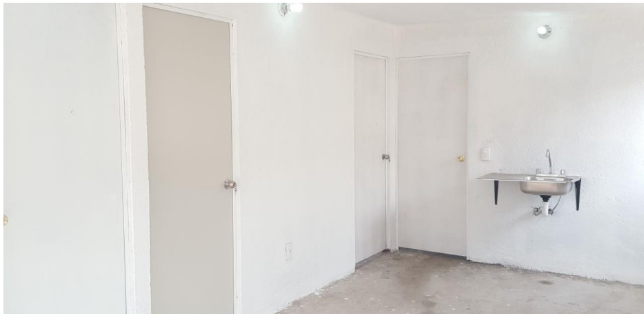
VISTA INTERIOR Y COLOCACION DE TARJA