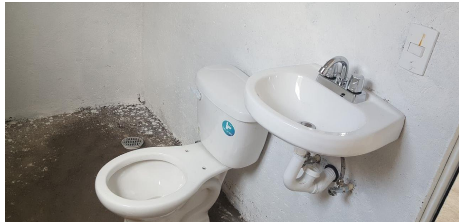
COLOCACIÓN MUEBLES DE BAÑO