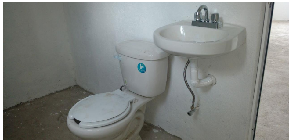
COLOCACION DE MUEBLES DE BAÑO