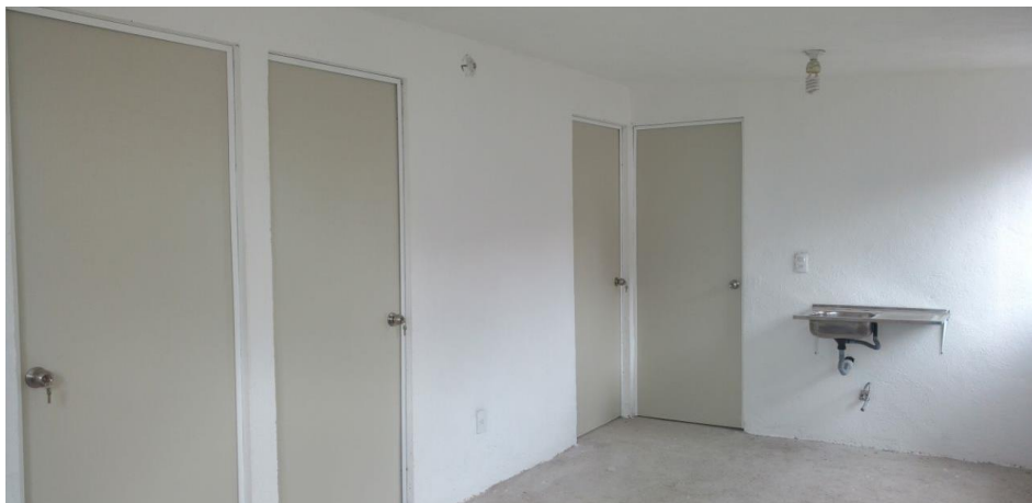
VISTA INTERIOR Y COLOCACION DE TARJA