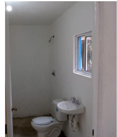
COLOCACIÓN MUEBLES DE BAÑO