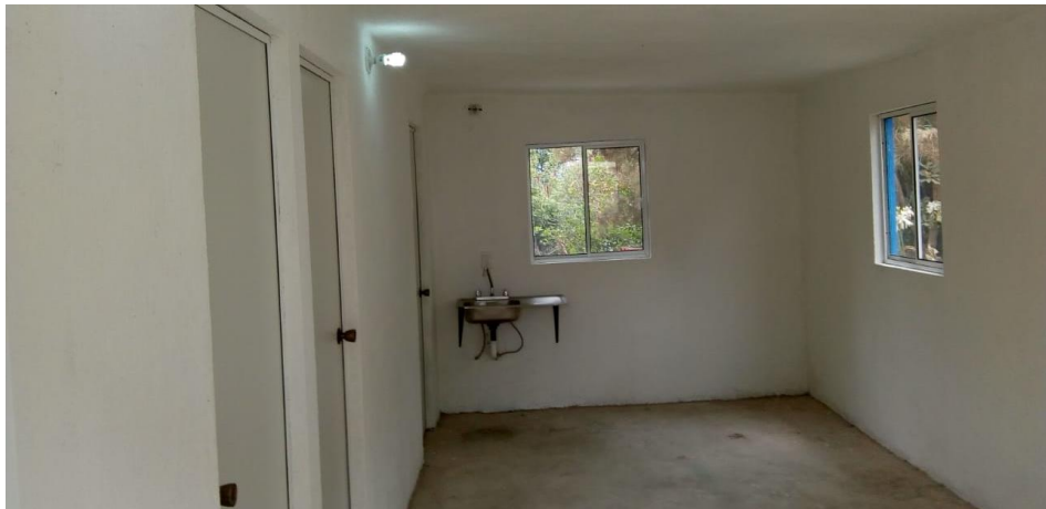
VISTA INTERIOR Y COLOCACION DE TARJA