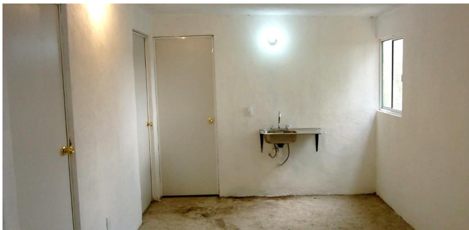
VISTA INTERIOR Y COLOCACION DE TARJA