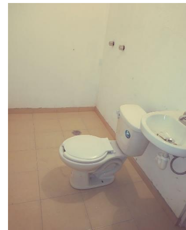
COLOCACIÓN DE MUEBLES DE BAÑO