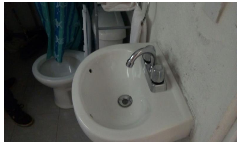
COLOCACIÓN MUEBLES DE BAÑO