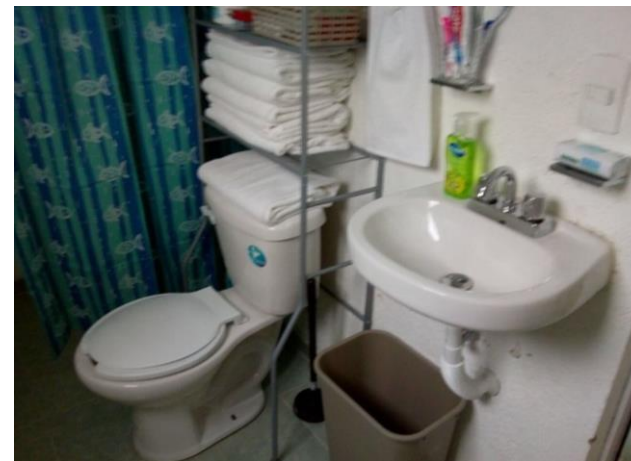
COLOCACIÓN MUEBLES DE BAÑO