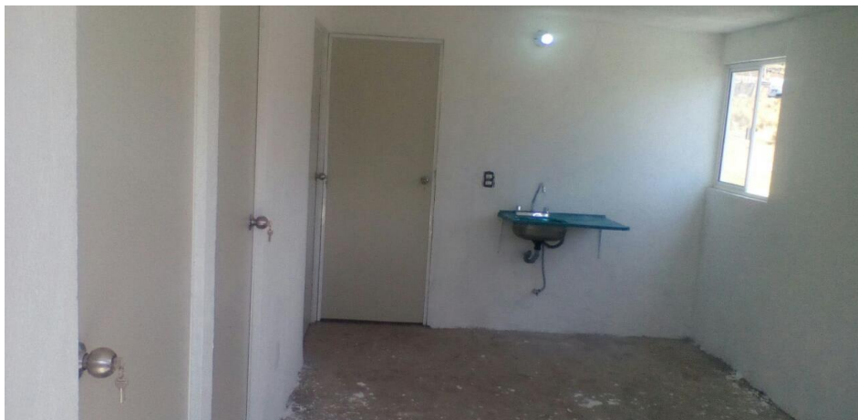
VISTA INTERIOR Y COLOCACION DE TARJA