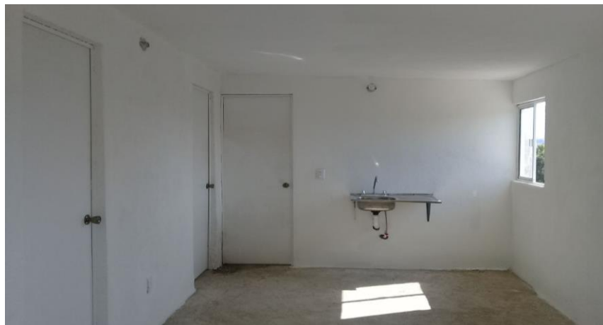
VISTA INTERIOR Y COLOCACIÓN DE TARJA.