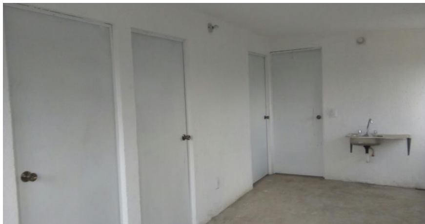
VISTA INTERIOR Y COLOCACIÓN DE TARJA.