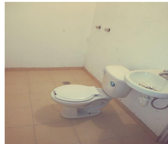
COLOCACIÓN DE MUEBLES DE BAÑO