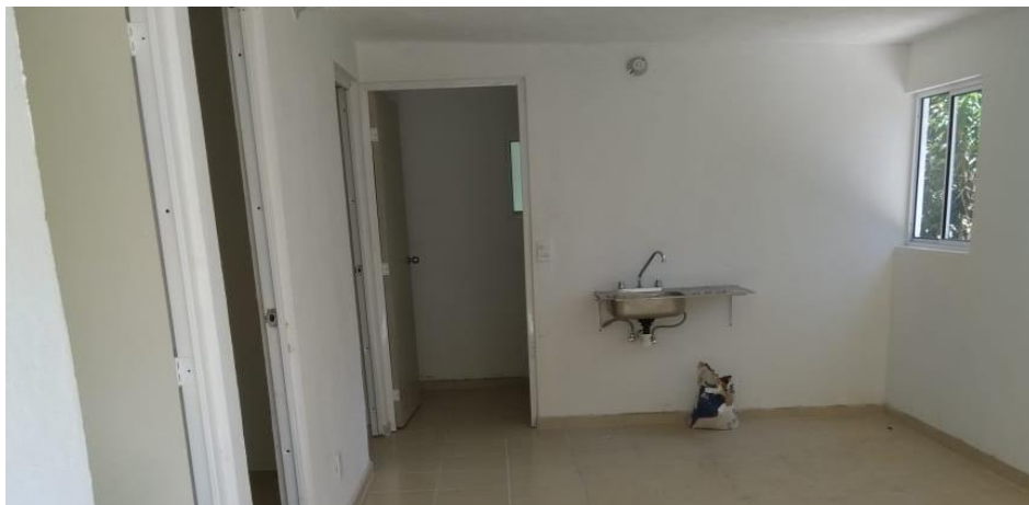
VISTA INTERIOR Y COLOCACIÓN DE TARJA