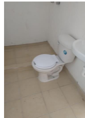
COLOCACIÓN DE MUEBLES DE BAÑO