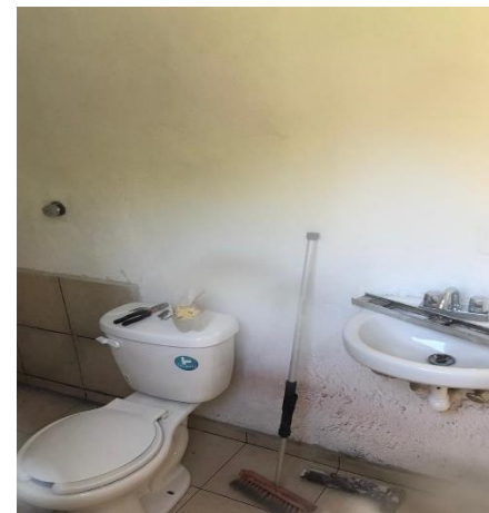
COLOCACIÓN DE MUEBLES DE BAÑO