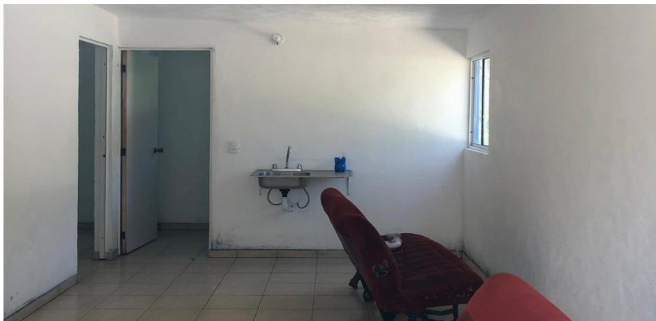
VISTA INTERIOR Y COLOCACIÓN DE TARJA