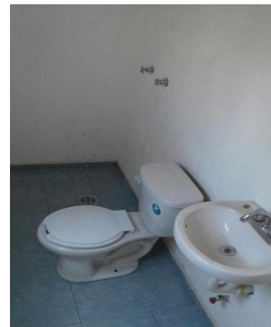
COLOCACION MUEBLES DE BAÑO