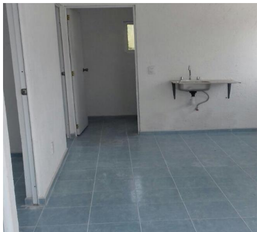
COLOCACION DE TARJA Y PUERTAS INTERIORES