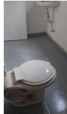
COLOCACION MUEBLES DE BAÑO