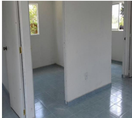
COLOCACION DE TARJA Y PUERTAS INTERIORES