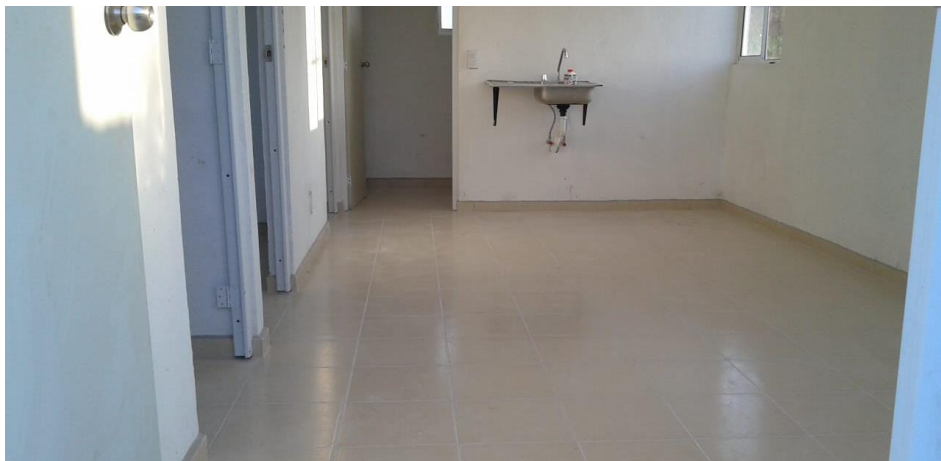
COLOCACIÓN DE TARJA Y VISTA INTERIOR