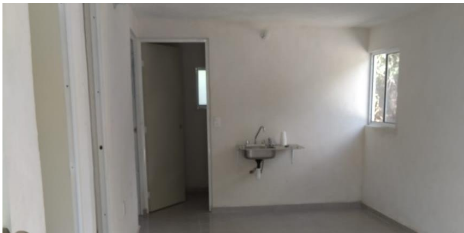
VISTA INTERIOR Y COLOCACION DE TARJA