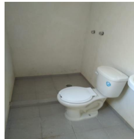
COLOCACIÓN MUEBLES DE BAÑO