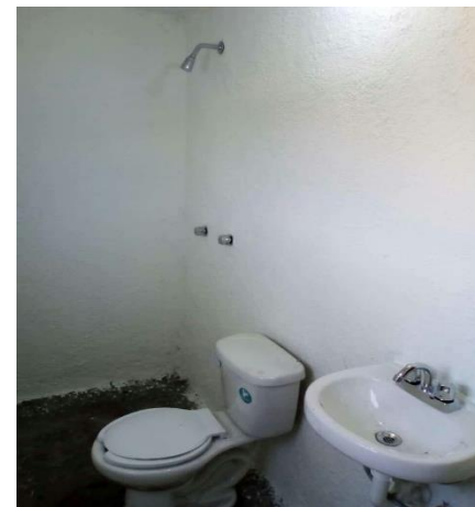
COLOCACION DE MUEBLES DE BAÑO