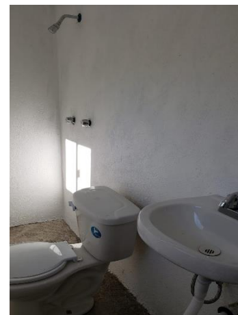
COLOCACIÓN DE MUEBLES DE BAÑO