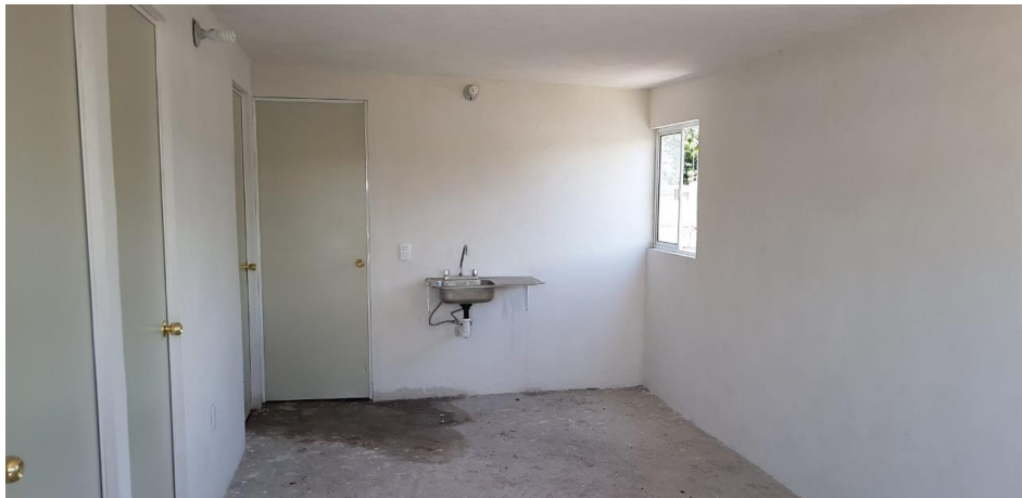
VISTA INTERIOR Y COLOCACIÓN DE TARJA