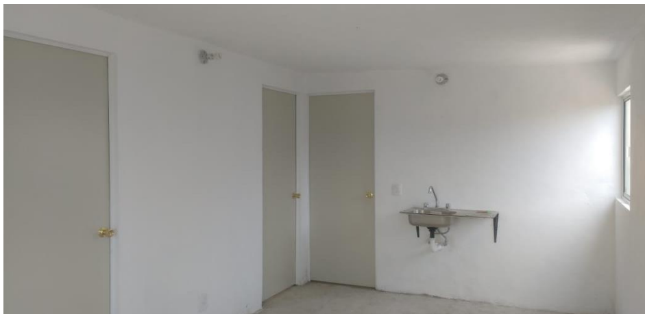
VISTA INTERIOR Y COLOCACION DE TARJA