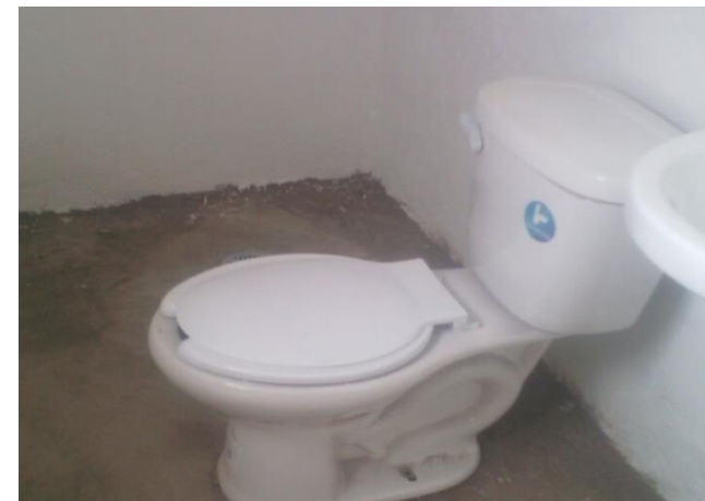
COLOCACIÓN DE MUEBLES DE BAÑO