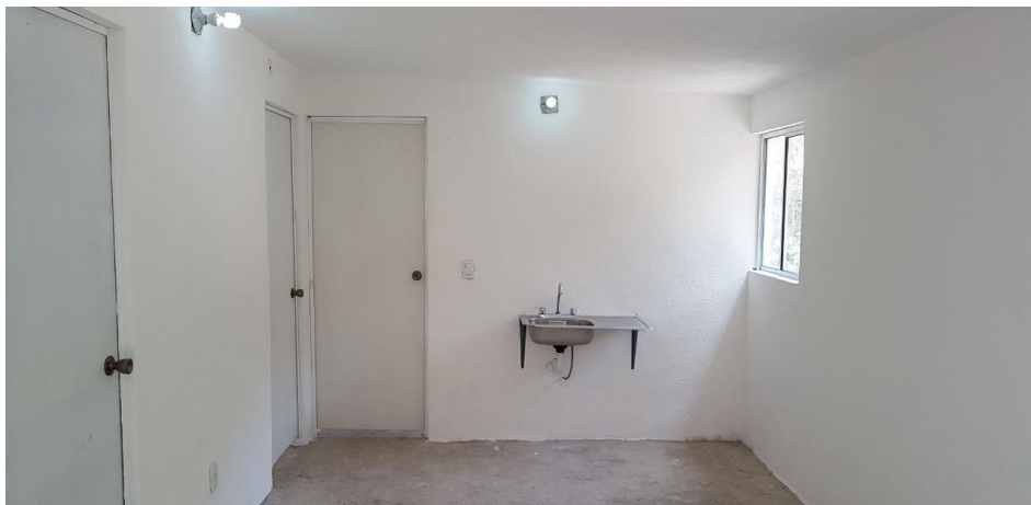
VISTA INTERIOR Y COLOCACION DE TARJA