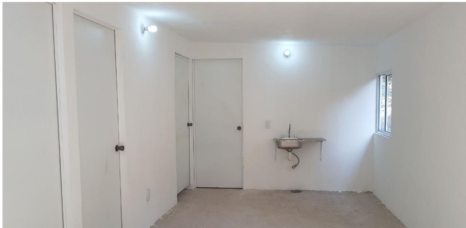
VISTA INTERIOR Y COLOCACION DE TARJA