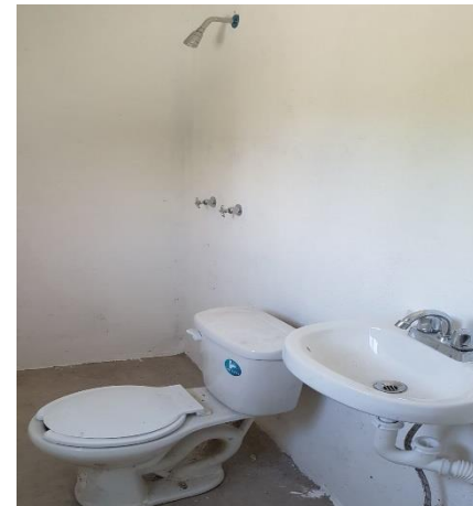
COLOCACION DE MUEBLES DE BAÑO