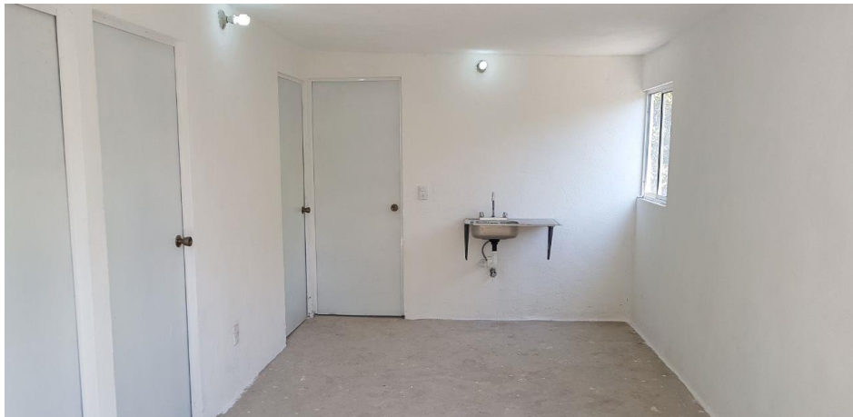
VISTA INTERIOR Y COLOCACION DE TARJA