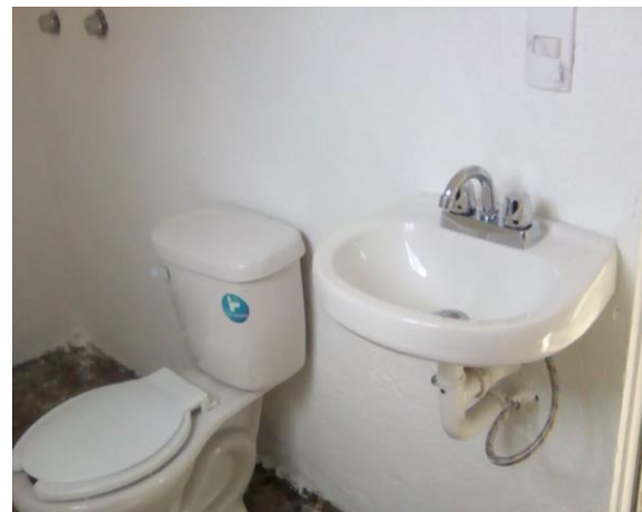
COLOCACIÓN DE MUEBLES DE BAÑO