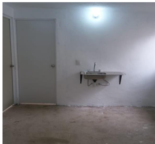
VISTA INTERIOR Y COLOCACIÓN DE TARJA