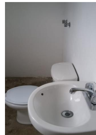
COLOCACIÓN DE MUEBLES DE BAÑO