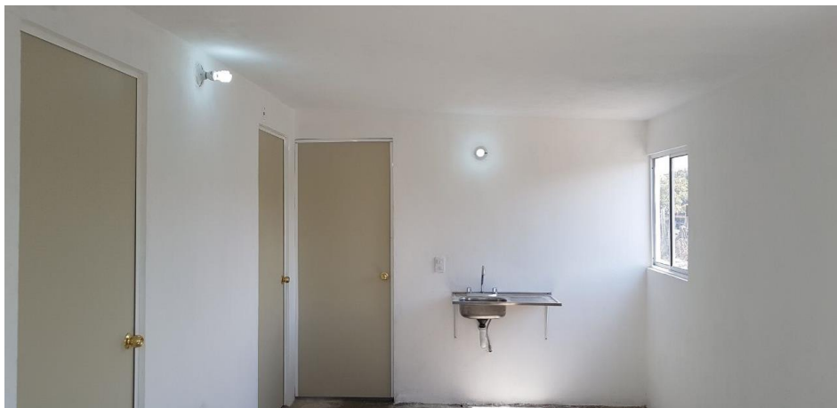
VISTA INTERIOR Y COLOCACION DE TARJA