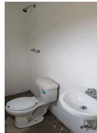
COLOCACION DE MUEBLES DE BAÑO