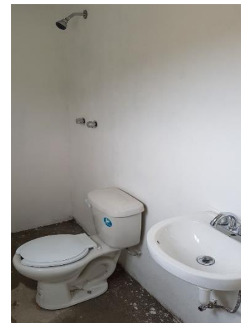
COLOCACIÓN DE MUEBLES DE BAÑO